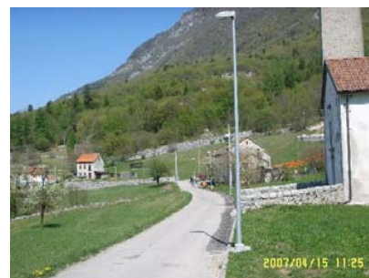
Un tratto di strada ben illuminato

E' stata inoltrata una formale richiesta all'amministrazione comunale per potenziare i punti luci nella frazione di Arsiè. La risposta è stata interlocutoria. Siccome alcune strade del paese sono completamente al buio, diventa poco agevole l'accesso delle famiglie alle loro case. Ci permettiamo pertanto di suggerire un baratto: il contributo previsto per la manifestazione Paesi Aperti anno 2008 venga utilizzato per realizzare almeno 4 punti luce. Quelli più urgenti.